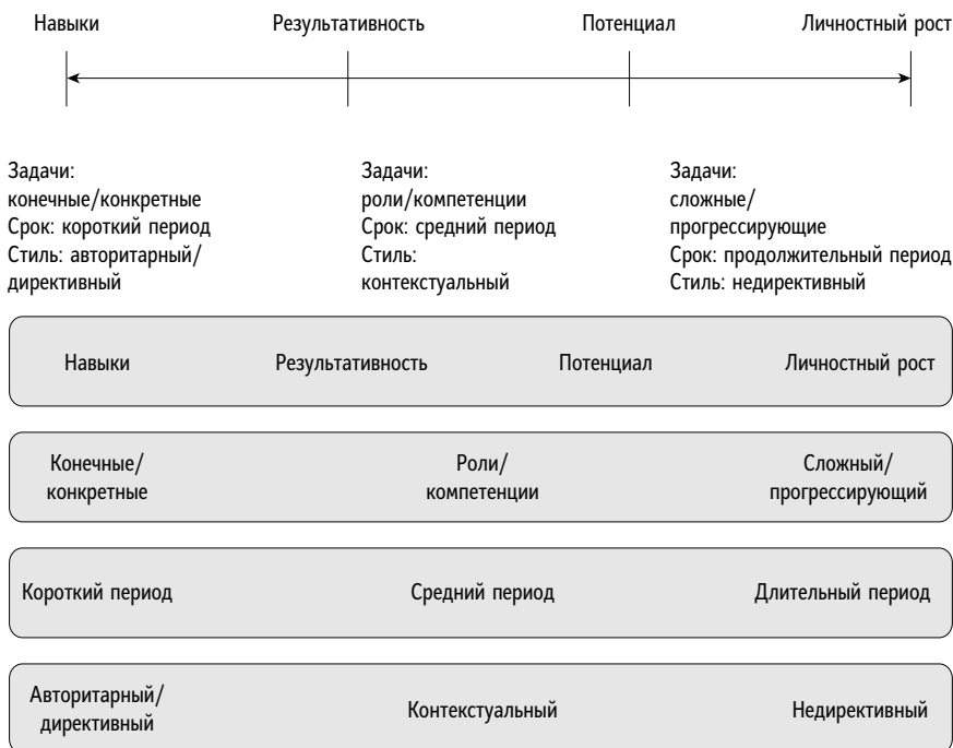
Рис. 1.2. Ситуационный спектр коуч-наставничества

На рисунке показаны типичные задачи и продолжительность отношений в каждом направлении и самый подходящий стиль вмешательства для каждой ситуации. Профессиональные и эффективные коучи и наставники должны обладать определенными знаниями, компетенциями, навыками и техниками, чтобы легко адаптировать свой стиль к конкретной ситуации даже в ходе одной беседы.